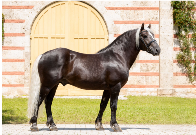
LH Markgraf v. B.Pr./LH Markus

Weitere Höhepunkte: MARKWARD v. LVV Modem wird aufgrund seiner überdurchschnittlichen Nachzucht als Elitehengst ausgezeichnet, sowie MARKGRAF v. Markus, der die Auszeichnung als Prämienhengst verliehen bekommt.